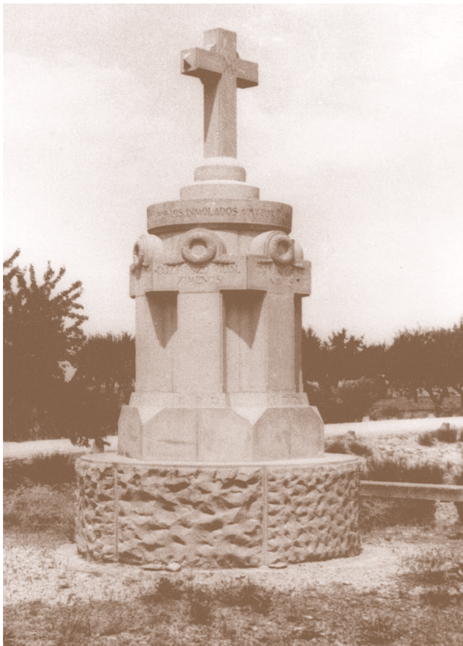
El Pla. Monument als arbecuins immolats el dia 13 d'agost de 1936